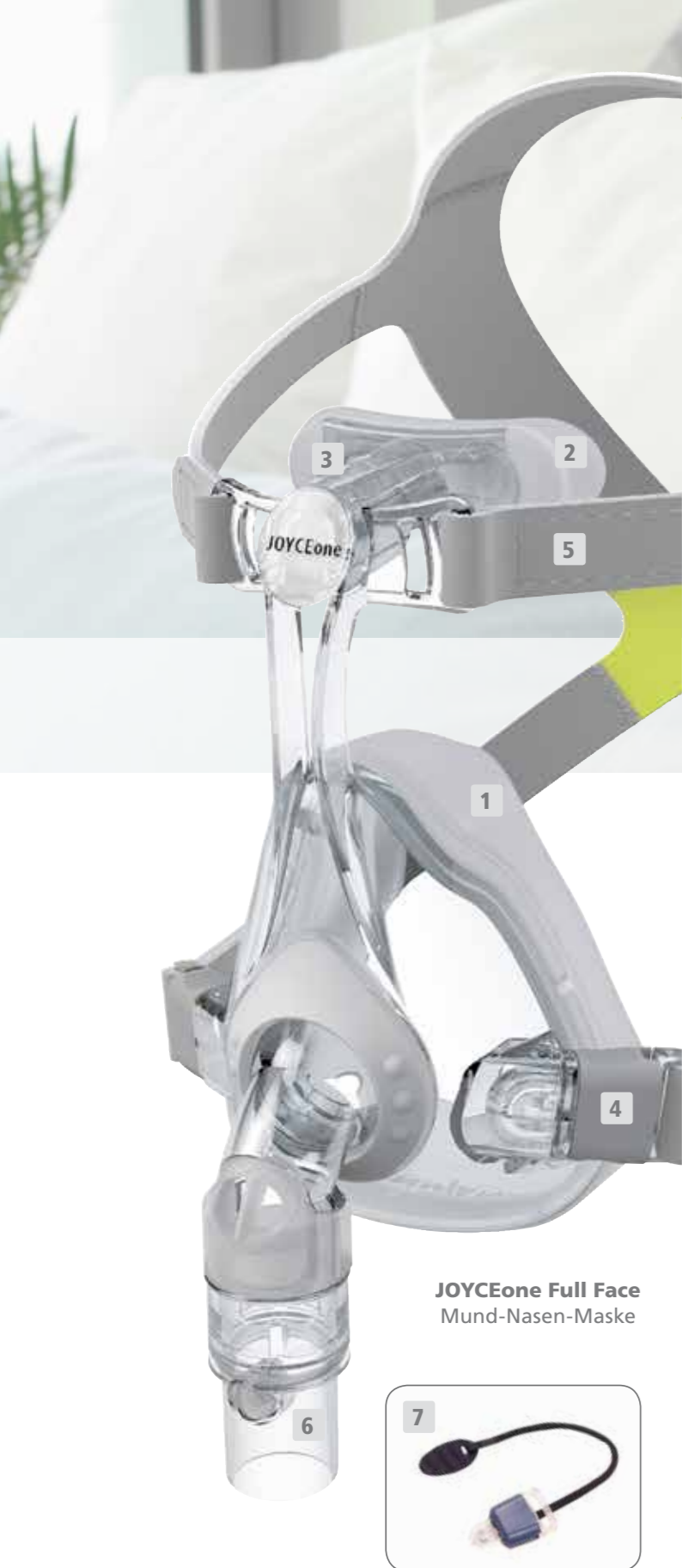
JOYCEone Full Face Mund-Nasen-Maske