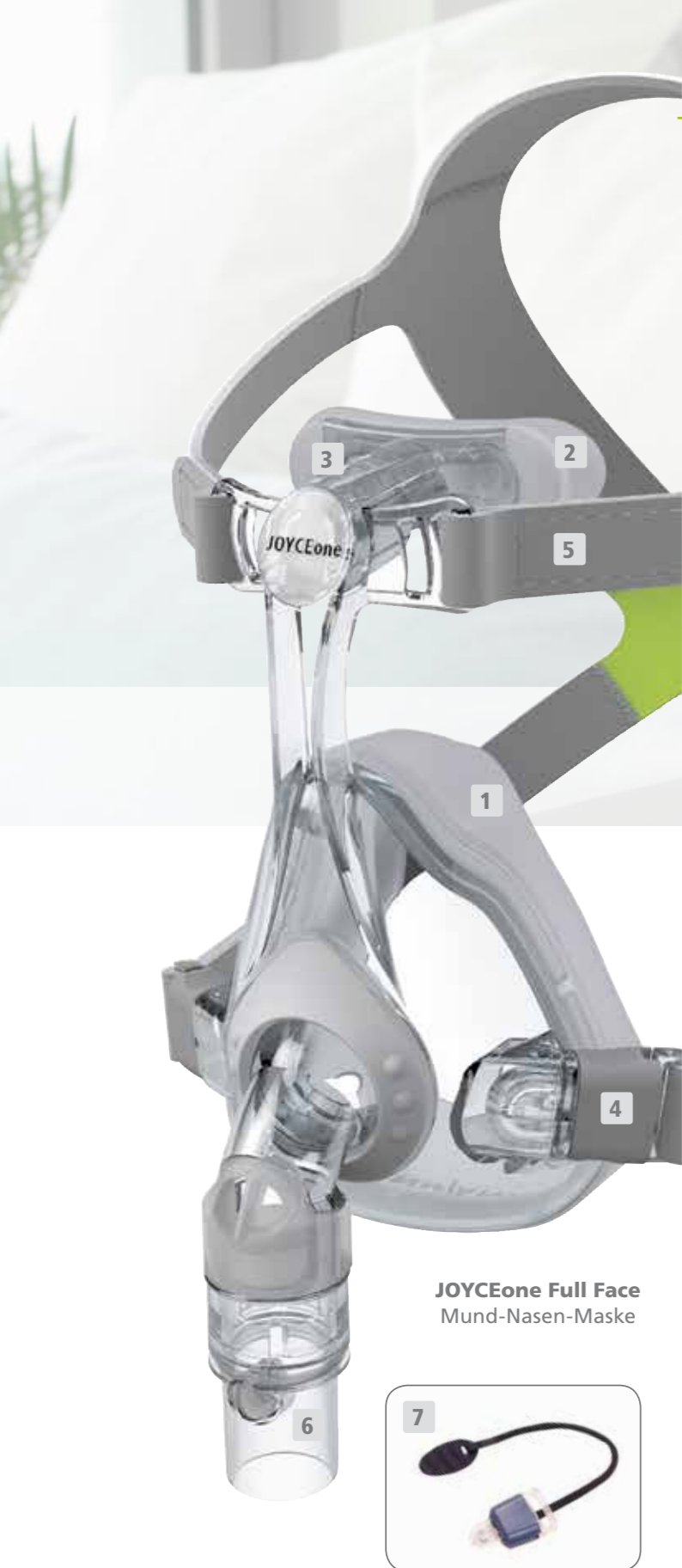
JOYCEone Full Face Mund-Nasen-Maske